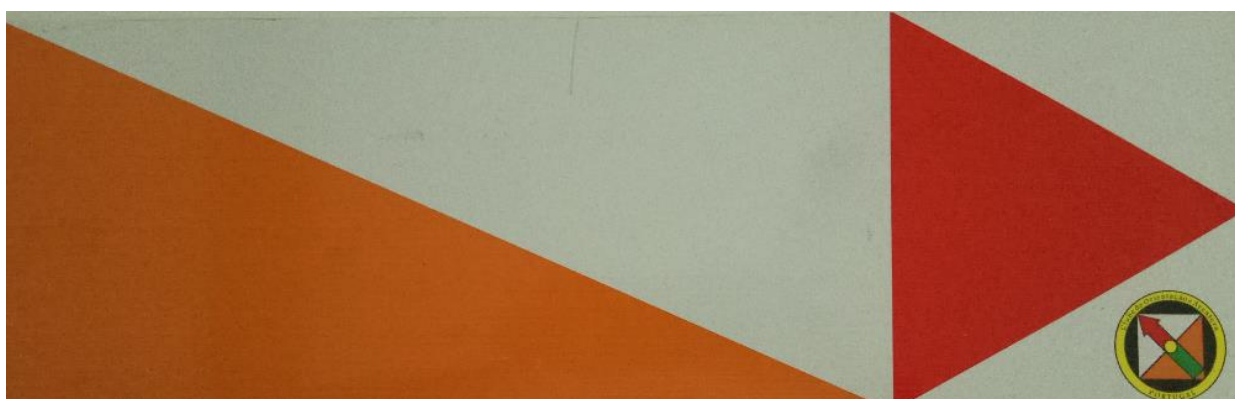
Fig. 1 - Placas direcionais acesso Parque Multiusos

Os participantes que utilizem a N3 em direção às Mouriscas, após entrarem na freguesia basta seguir as placas colocadas pela Organização em direção ao Parque Multiusos.