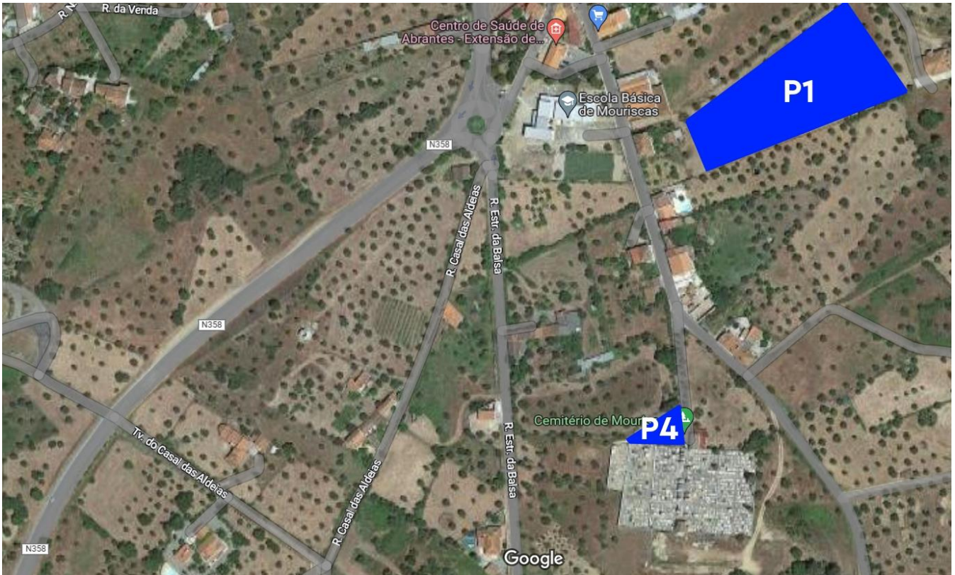
Fig. 2 – Estacionamento P1 e P4